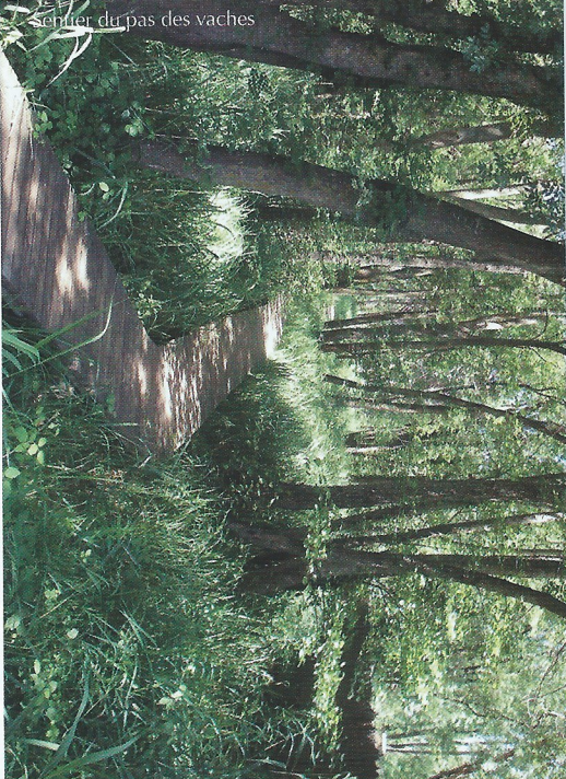
Sentier du pas des vaches